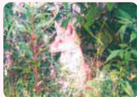
生きている「豊中のごん」