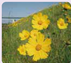
法律で禁止された特定外来生物 オオキンケイギク

外来生物は地域の生態系に大きな影響を与えています。ペットで飼っていたアカミミガメ(ミドリガメ)を野生に放したり、オオキンケイギクを育てることは法律で禁止されています。