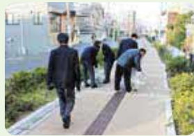
高校生による地域清掃