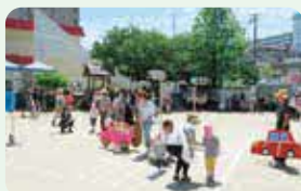
学校・園での交通安全教室