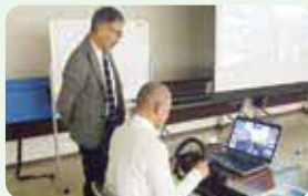
エコドライブ講習会