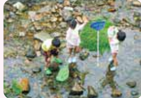
天竺川の河川開放