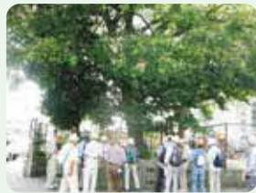
保護樹木・大木・古木を訪ねて