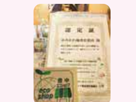
豊中エコショップ制度

39 事業所や工場・店舗から出る廃棄物の削減に努めて、循環型社会の実現に向けた取り組みを進めよう