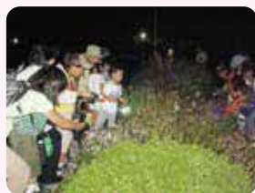
秋の夜の鳴く虫観察会