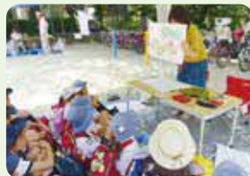
フェアトレードに関する学習