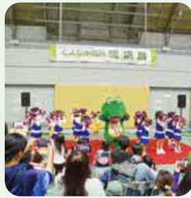
とよなか市民環境展