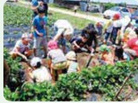
さつまいも掘り体験