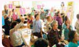
地域での環境学習(出前講座)