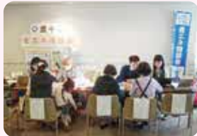
家庭の省エネチェック (省エネ相談会)

24 エアコンは消費電力量の少ない温度設定にするなど、省エネの生活を心がけよう ☺