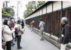
ちょっといい豊中 見つけにいいかウォーク