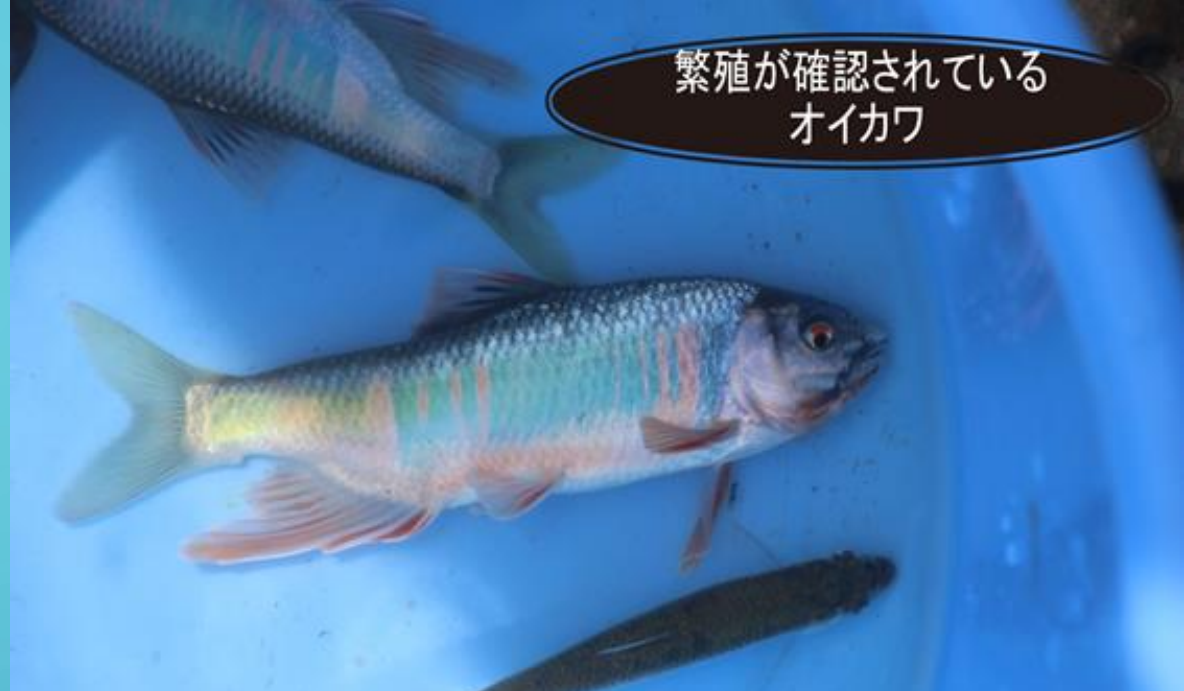
繁殖が確認されている オイカワ