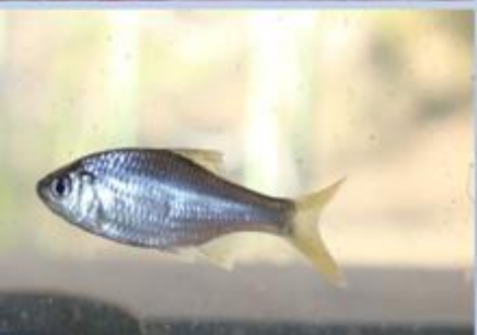
ヤリタナゴの稚魚