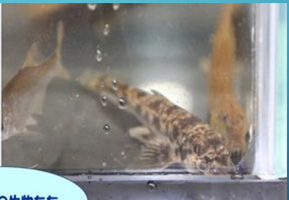
ハート池の生物たち