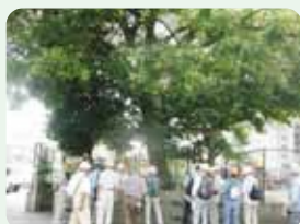
保護樹木・大木・古木を訪ねて