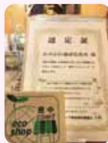
豊中エコショップ制度

48 ペットボトルやプラスチックトレイなどの使い捨て容器をできるだけ使わないようにしましょう 🏠 📴