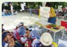
フェアトレードに関する学習

23 今を生きる人が他者(次世代、他地域、他の生物など)に責任を押しつけず、生産活動や消費行動の環境影響を広い視野で考えよう