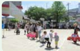
学校・園での交通安全教室