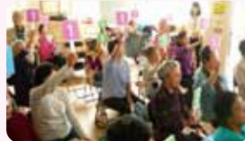
地域での環境学習(出前講座)