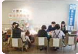
家庭の省エネチェック (省エネ相談会)

27 冷暖房は消費電力量の少ない温度にしよう (冷房は 28 度、暖房は 20 度程度) 🏠 📶