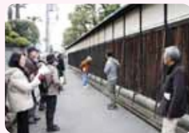
ちょっといい豊中 見つけにいかウォーク

10 ISO14001 など既存の環境マネジメントシステムの認証取得や、独自の環境マネジメントに取り組もう