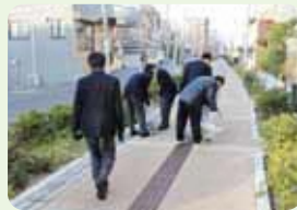
高校生による地域清掃

15 工場や事業所の周辺や屋上、壁面緑化を進め、「みどりのまちづくり」や「生物多様性」に貢献しよう