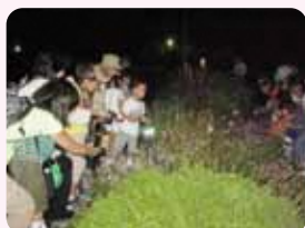
秋の夜の鳴く虫観察会

78 洗たくや打ち水、植物の水やりには風呂の残り湯や雨水タンクを利用し、資源を有効に活用しよう🏠😊