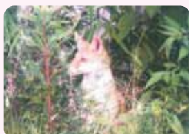
生きている「豊中のごん」