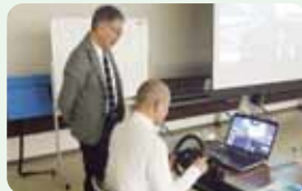
エコドライブ講習会