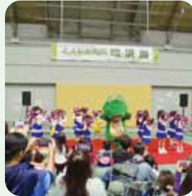
とよなか市民環境展