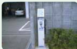
事業者による急速充電ステーションの設置

38 標識や専用道など、歩行者が歩きやすく、自転車が走りやすい道づくりを進めよう