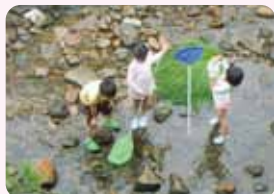
天竺川の河川開放