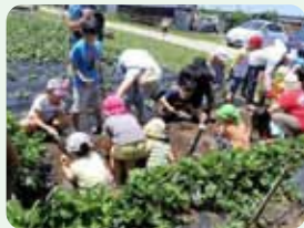
さつまいも掘り体験