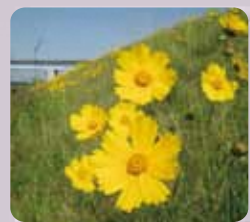
法律で禁止された特定外来生物 オオキンケイギク

外来生物は地域の生態系に大きな影響を与えています。アカミミガメ(ミドリガメ)のようにペットで飼っていたものを野生に放したり、きれいだからといってオオキンケイギクなどの植物を育てるとは絶対にやめましょう。